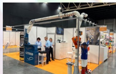
Le Stand GINDRO au salon VRAC TECH.

L'ensemble s'est déroulé dans une atmosphère conviviale et bienveillante, permettant des moments agréables autour des spécialités de notre région. Cette édition s'est donc révélée intéressante en termes d'opportunités commerciales et d'échanges constructifs. Nous attendons avec impatience de confirmer ces impressions lors de l'édition mâconnaise l'an prochain.