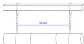
Schéma supportage avec câbles GHF