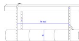
Schéma supportage avec bandes BASL