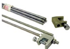
CRAF + TIFI