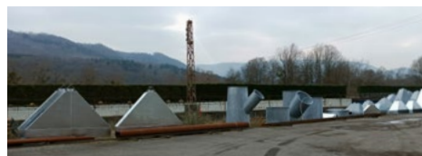
Toutes les pièces ont été livrées en temps et en heure en outre-mer.