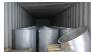
De nombreux diamètres étaient supérieurs à \varnothing 800 .

Il fallait d'abord produire les pièces (allant du \varnothing 160 au \varnothing 1250 ), puis calculer le volume total de la marchandise afin de réserver les conteneurs nécessaires auprès du port d'Amsterdam. Nous avons dû nous coordonner avec le client final et les autorités locales pour établir les documents douaniers. Ces livraisons devaient également se conformer au planning prévu par DEF-TEC pour que le montage puisse se faire en parallèle.