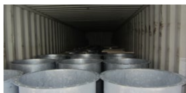
Gindro s'est occupé de charger les conteneurs.

élevée en cette période de l'année. Il fallait en plus gérer le fait que les pièces devaient être envoyées en sous-traitance pour la galvanisation à chaud, puis être chargées dans des conteneurs pour être acheminées dans un port aux Pays-Bas. »