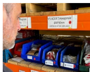
Les stocks sont visibles immédiatement

se répercutera positivement sur les clients. Il nous faudra encore quelques mois pour parfaire la numérisation et la gestion des stocks. Une fois ces opérations achevées, le résultat sera un gain de rapidité et d'efficacité, qui sera perceptible lors de nos échanges.