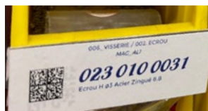
Un exemple de code Datamatrix