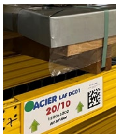
Le nouveau référencement des pièces

Nous poursuivons la modernisation de notre outil de production avec cette fois un effort au niveau de la numérisation de nos process. Cette étape est le fruit d'un changement important initié il y a deux ans par notre service Achats. Sophie et son équipe ont d'abord créé des codes articles dans notre ERP pour pouvoir y intégrer les commandes achats, puis ils ont réétiqueté l'ensemble des contenants avec des codes Datamatrix. Cette intervention préalable était indispensable à l'intégration des douchettes. Nous disposons maintenant de terminaux portatifs qui nous permettent de suivre les niveaux de stock en temps réels sans avoir besoin d'effectuer une vérification de visu. Ce changement de culture vers une production plus interactive promet un gain de productivité qui